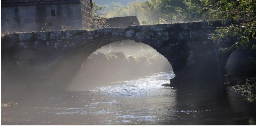
Most u Grabu ,2020