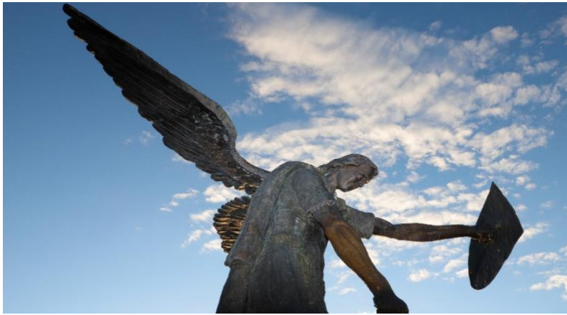
Sv. Mihovil, 2022