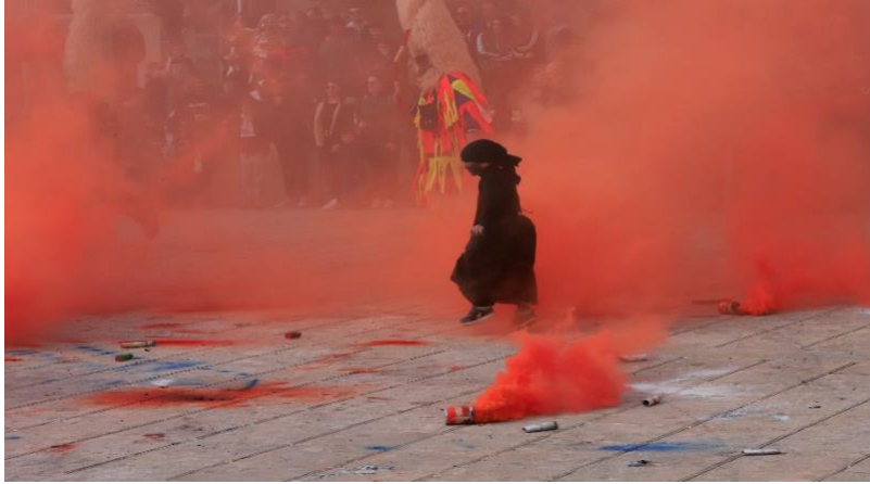
Kamešnički didi, 2022